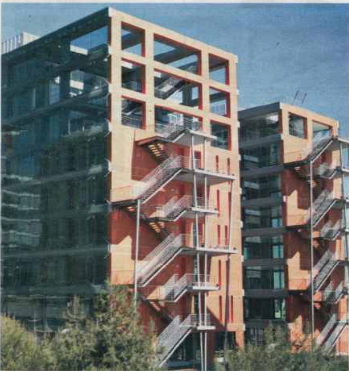
■ ■ ■ Empreendimento de escritórios arrecadou 'oscar' de melhor do ano