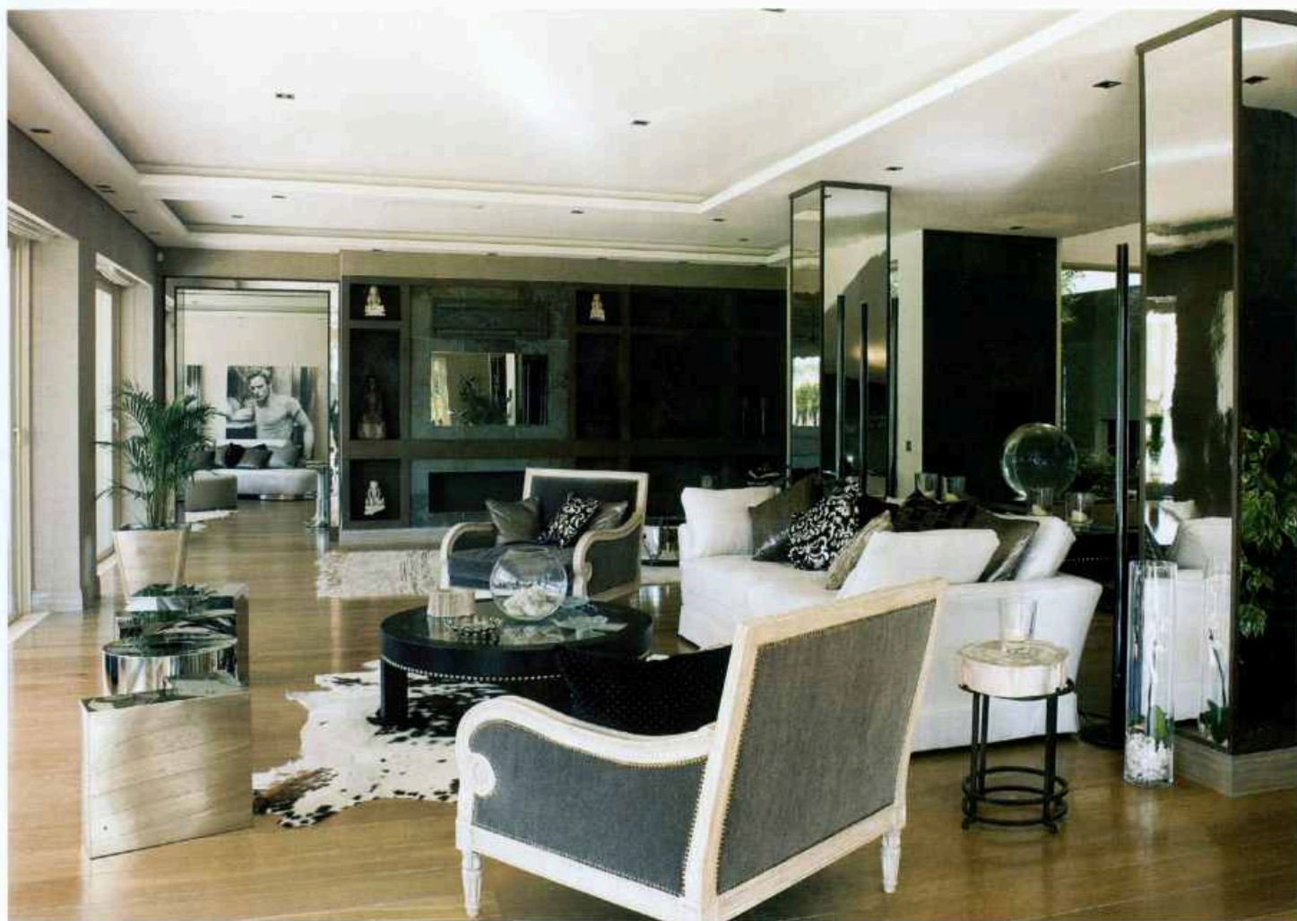
SALA DE ESTAR As colunas quadradas, as ombreiras e o mobiliário revestidos a espelhos otimizam a luz natural. Quatro assentos metálicos brilhantes alinham-se para formar a palavra 'Love', em puro estilo Pop Art. Em harmonioso contraste, poltronas clássicas de inspiração francesa.