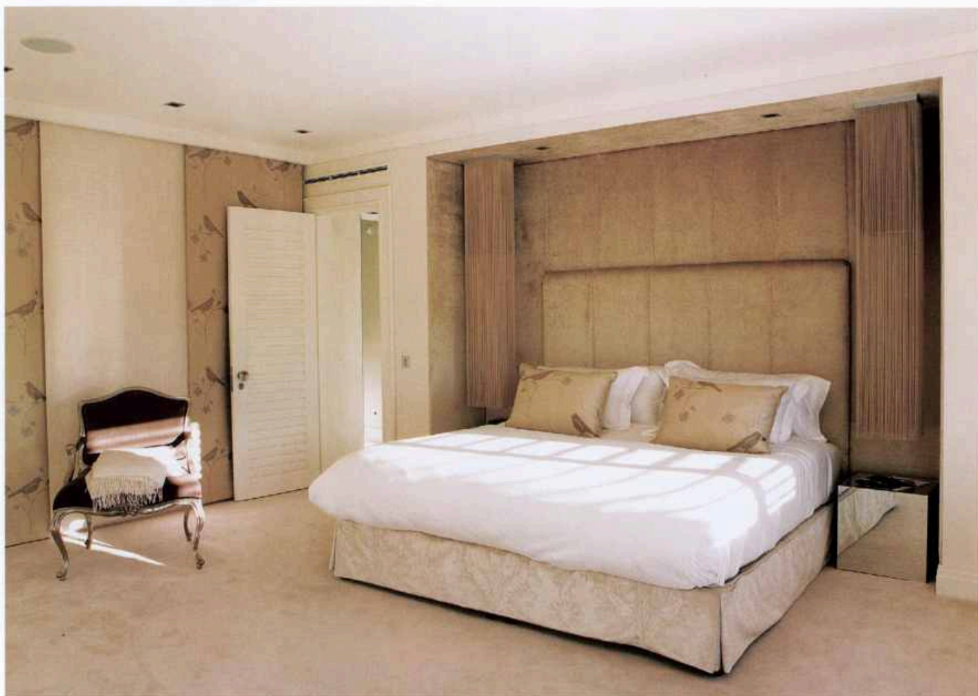
SUÍTE DO CASAL Despojada, mas eclética: as mesas-de-cabeceira cúbicas espelhadas são contemporâneas, a poltrona inspira-se nas formas clássicas francesas. Cama, da Four Seasons, enquadrada por cabeceira estofada a tecido, adquirida em Londres, na Andrew Martin International.